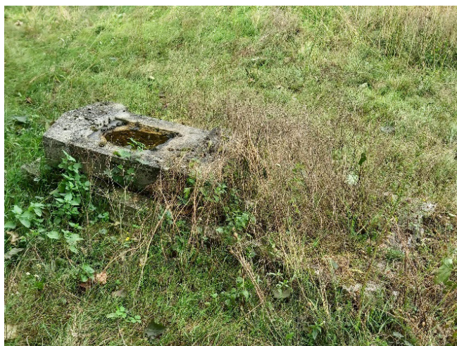
Fotografia 6. Cmentarz w Hohenbachu (1)