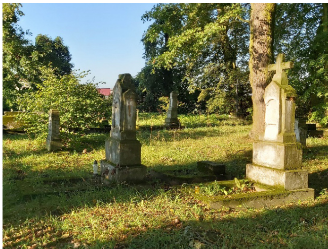
Fotografia 2. Cmentarz w Gawłowie Nowym