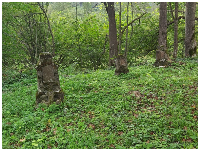
Fotografia 5. Cmentarz w Steinfels