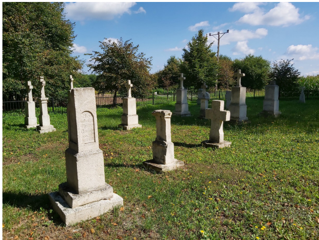
Fotografia 1. Cmentarz w Reichau