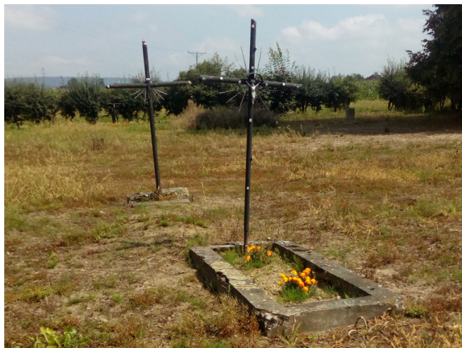
Fotografia 3. Cmentarz w Stadłach