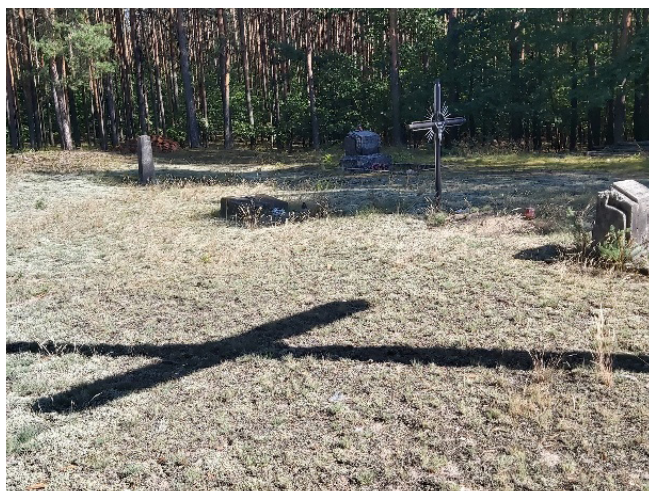
Fotografia 4. Cmentarz w Reichsbeim