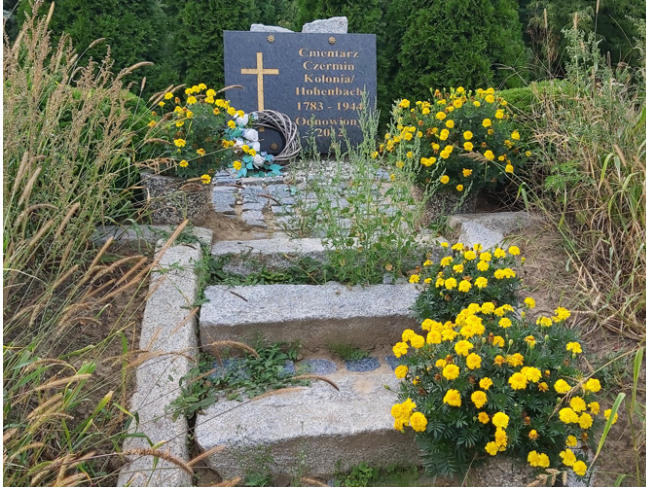
Fotografia 7. Cmentarz w Hohenbachu (2)