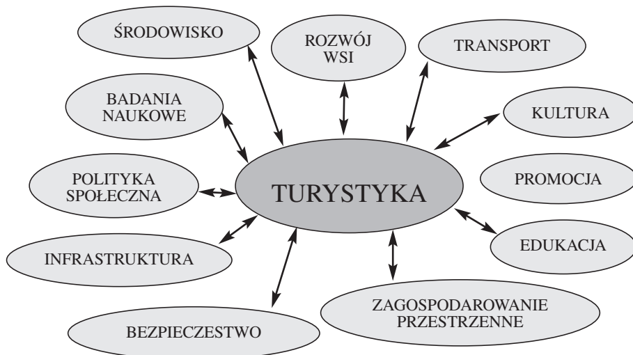
RYСУNEK 1. Powiązanie turystyki z różnymi sferami działania

ży, że problematyka rozwoju turystyki jest złożona ze względu na zróżnicowanie obejmujących ją zjawisk i zagadnień. Turystyka nie jest jednorodną, zwartą dziedziną gospodarki; składa się na nią kilkadziesiąt samodzielnych sektorów gospodarki, powodując często implikacje natury organizacyjnej, produkcyjnej, prawnej i technologicznej, a w następstwie tego i instytucjonalnej (rysunek 1).