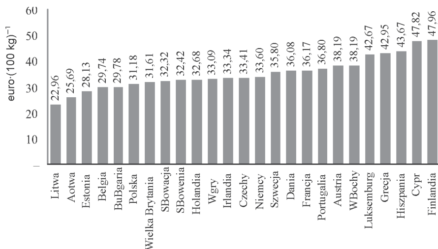
RYSUNEK 1. Ceny uzyskiwane przez producentów mleka w krajach UE-27, lipiec 2008 rok

Porównując ceny otrzymywane przez producentów mleka w poszczególnych państwach Wspólnoty, można stwierdzić, iż relatywnie najwyższe otrzymują producenci w krajach skandynawskich, w Luksemburgu, Austrii, Dani, Francji oraz w państwa położonych w południowej części Wspólnoty (rysunek 1). Ceny mleka w Polsce należą do jednych z niższych w UE-27. Według Dairy Report 2008, Polska posiada znaczne przewagi kosztowe w porównaniu do innych państw Wspólnoty, co czyni tu produkcję mleka jedną z najbardziej konkurencyjnych na świecie. Generalnie dzięki wsparciu rynkowemu i kwotowaniu produkcji ceny mleka i jego przetworów w Unii Europejskiej kształtowały się na znacznie wyższym poziomie niż ceny światowe. Zgodnie z reformą luksemburską z 2003 roku, wsparcie to od 2004 roku jest stopniowo obniżane, a niższe dochody producentów mleka, wynikające z obniżki cen, rekompensowane są dopłatami bezpośrednimi, włączonymi od 2006 roku do jednolitych płatności powierzchniowych. Pomoc ta jest zatem całkowicie niezwiązana z wielkością produkcji.