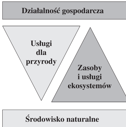
RYSUNEK 2. Relacje między działalnością gospodarczą a środowiskiem naturalnym

Już obecnie na wielu obszarach cennych przyrodniczo możemy wskazać przykłady działalności gospodarczej, charakteryzującej się pozytywnym, a przynajmniej neutralnym wpływem na przyrodę. Takie przykłady pozytywnego związku biznesu i ochrony przyrody wymagają promocji i naśladowania. Doświadczenia innych krajów, analiza potrzeb aktywnej ochrony przyrody oraz możliwości stwarzane przez powstającą sieć Natura 2000 wskazują, że wachlarz możliwych do podjęcia różnych form działalności gospodarczej wykracza poza dotychczasowe doświadczenia i postrzeganie powstających możliwości. Jednocześnie dostępne wyniki badań wskazują wyraźne zainteresowanie i zapotrzebowanie małych i średnich przedsiębiorstw na nowe, przyjazne i właściwie dostosowane mechanizmy finansowe, wychodzące naprzeciw ich potrzebom inwestycyjnym i wymogom działalności gospodarczej na cennych przyrodniczo terenach.