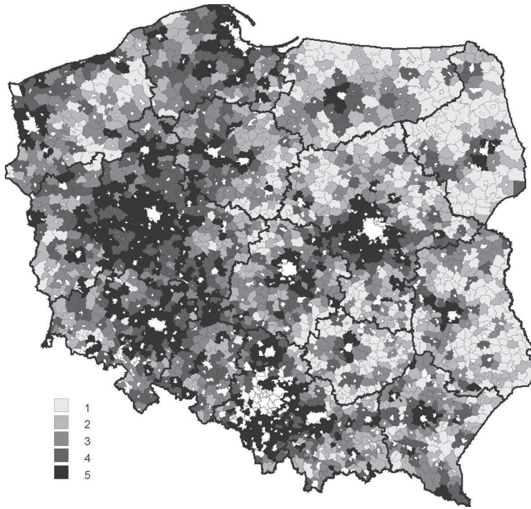
RYSUNEK 1. Poziom rozwoju społeczno-gospodarczego obszarów wiejskich w Polsce: 1–5 stopnie poziomu rozwoju według miernika syntetycznego – od najniższego do najwyższego