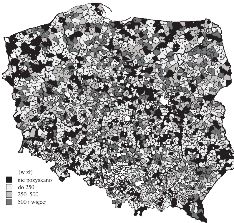
RYSUNEK 3. Wartość wnioskowanej dotacji przeznaczonej na działanie 3. programu SAPARD na 1 mieszkańca (wnioski poprawne formalnie)

Można by sądzić, że nie istnieje w Polsce gmina, która nie miałaby niezaspokojonych potrzeb w zakresie objętym działaniem 3. SAPARD-u. Jednak okazało się, że wiele gmin nie składało żadnych wniosków o dofinansowanie inwestycji infrastrukturalnych, choć możliwe do uzyskania było dofinansowanie sięgające 75% wartości inwestycji. Żadnego wniosku nie złożyły aż 473 gminy, a więc 21,8% ich ogólnej liczby. Drugi biegun rozkładu stanowiło 65 gmin składających wnioski o dofinansowanie przekraczające 1 tys. zł w przeliczeniu na mieszkańca (rysunek 3).