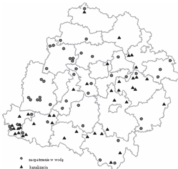
RYSUNEK 3. Zadania inwestycyjne zrealizowane w ramach programu SAPARD

Dane dotyczące wymienionych efektów rzeczowych w podziale na powiaty zawiera tabela 2, a rodzaj i miejsca zrealizowanych przedsięwzięć w obu turach Programu pokazuje rysunek 3.