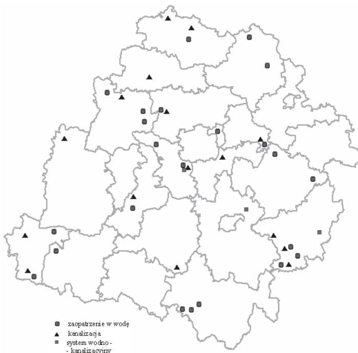
RYSUNEK 4. Projekty zrealizowane w ramach ZPORR

Realizacja działań w ramach priorytetów 1 i 3 współfinansowana jest z Europejskiego Funduszu Rozwoju Regionalnego (EFRR). Beneficjenci mogli uzyskać z tego źródła dofinansowanie w wysokości do 75% kosztów kwalifikowanych zadania (oraz dodatkowo ze środków budżetu państwa do 10% w priorytecie 1 i do 25% w priorytecie 3). Do końca 2007 roku w Instytucji Pośredniczącej ZPOOR w Łodzi (Urząd Wojewódzki) podpisano 39 umów dotyczących