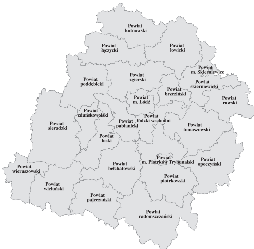
RYСУNEK 1. Podział administracyjny województwa – powiaty

Tereny nieurbanizowane są słabo zaludnione, średnio 53 os./km 2 . Mieszka na nich zaledwie 458 tys. osób, tj. 35,4% ogółu ludności województwa [Województwo... 2007]. Wiejska sieć osadnicza, którą tworzy 5191 miejscowości (prawie 3 tys. sołectw), charakteryzuje się dużym, większym niż średnio w kraju udziałem małych jednostek osadniczych (liczących od kilku do kilkunastu zagród) i rozproszeniem zabudowy. Ma to istotny wpływ m.in. na rozwój sieci wodociągowej i kanalizacyjnej, ponieważ bardzo podnosi koszt ich budowy. W wielu przypadkach ze względów ekonomicznych, zwłaszcza jeżeli chodzi o kanalizację zbiorczą, inwestycje w takich rejonach są nieopłacalne. Dodatkową barierę stanowi fakt, że środki własne, znajdujące się w dyspozycji władz lokalnych, z racji rolniczego, przeważnie niskotowarowego charakteru gospodarki oraz dość słabych gleb są w większości gmin bardzo ograniczone. W 2006 roku aż w 110 przypadkach nie przekraczały 800 zł na 1 mieszkańca, a w 71 z nich wynosiły poniżej 600 zł na 1 mieszkańca, przy średniej krajowej 1046 zł [Bank...]. Najwięcej takich jednostek jest w powiatach: sieradzkim, wieluńskim, radomszczańskim, opoczyńskim, tomaszowskim, łęczyckim i skierniewickim.