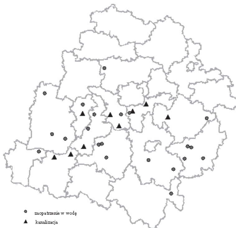
RYSUNEK 2. Zadania inwestycyjne zrealizowane w ramach programów PHARE RAPID i STRUDER 2

W latach 1997–1998 z pomocy programu RAPID na inwestycje dotyczące zaopatrzenia wsi w wodę skorzystało na charakteryzowanym w niniejszym artykule terenie 16 gmin, z tego: w byłym województwie łódzkim 2 (Parzęczew i Rzgów), piotrkowskim 8 (Aleksandrów, Opoczno, Paradyż Przedbórz, Rozprza, Rzczyca, Sławno i Zelów), sieradzkim 6 (Burzenin, Brzeźnio, Sędziejowice, Goszczanów, Lututów i Łask) – rysunek 2. Każda z nich uzyskała dofinansowanie jednego projektu w wysokości od 38,6 do 52,6% wartości realizowane-