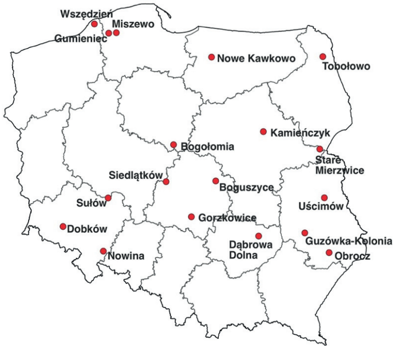
Rysunek 1. Rozmieszczenie wsi wybranych do badań